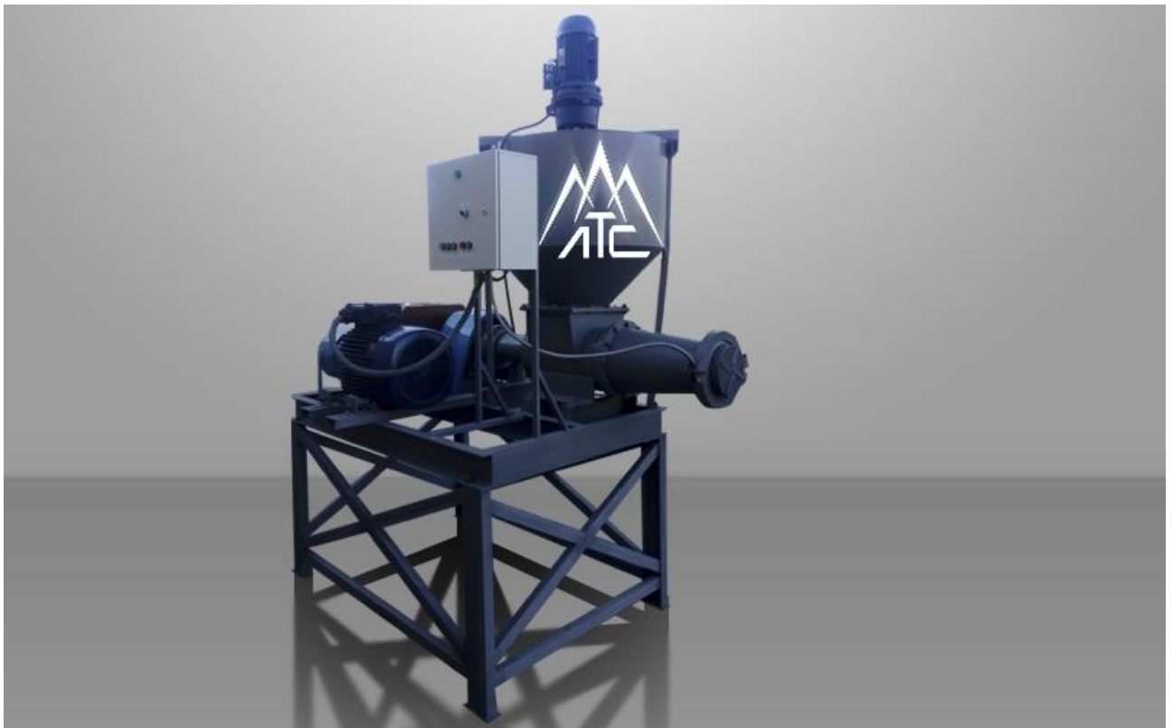
1 Устаткування для гранулювання опалого листя – 150000грн

Для обладнання виробничого приміщення необхідно таке обладнання: