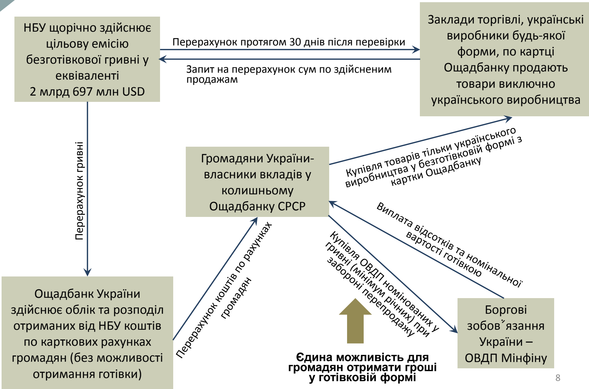
СХЕМА ФІНАНСУВАННЯ ПРОЕКТУ